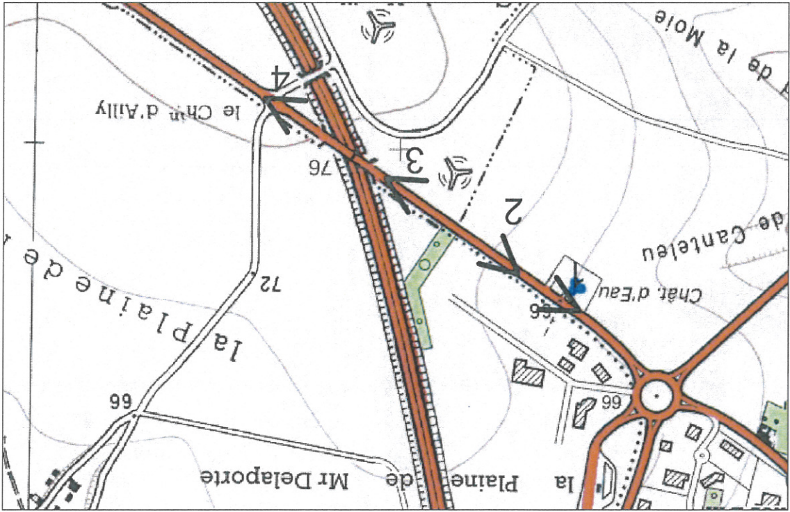
8.1 Annexes obligatoires : Photographies datées - Projet de carrefour giratoire RD4901